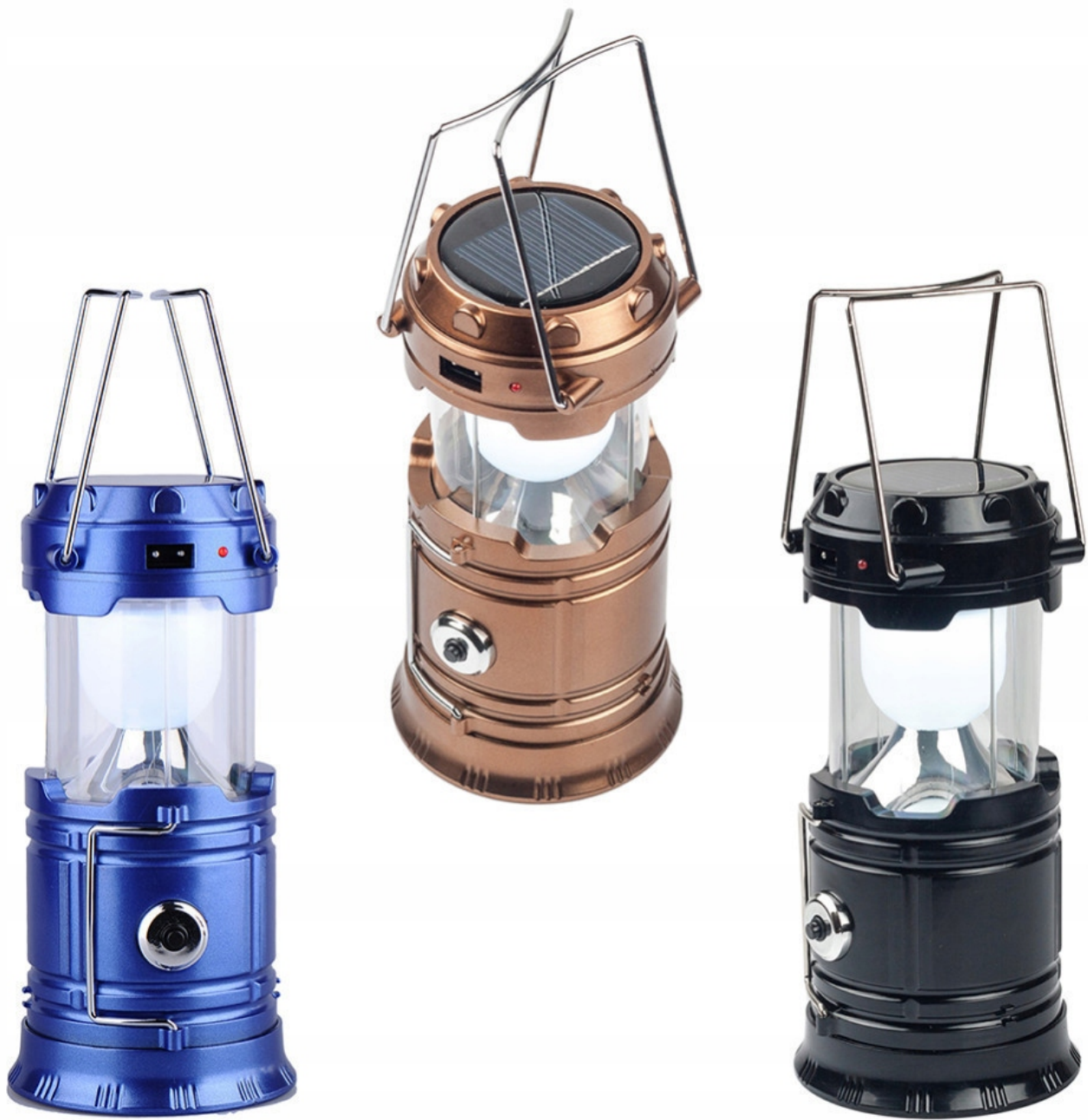
LATARKA ŁADOWANA Z WBUDOWANEGO PANELA SŁONECZNEGO LUB SIECI 230V .