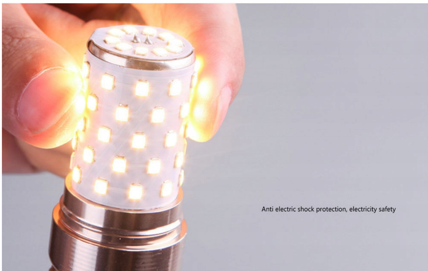
Anti electric shock protection, electricity safety