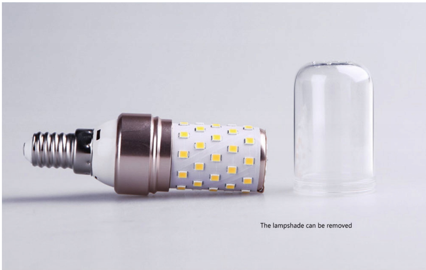
The lampshade can be removed